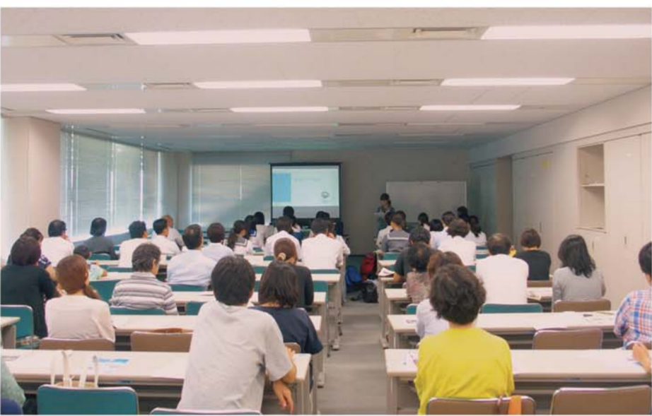
事後研修会での英語プレゼンテーションの様子

同時に異文化にふれてグローバル感覚を養う狙いもある。18日間の滞在費を県内企業が後押ししている。外部検定試験で効果測定もしている。研究期間中は7月下旬に熊本を出発し、8月9日に帰国する18日間。宿泊は大学寮で朝9時から午後3時まで。は大学付属の語学学校で研修。週末には州北部にあるクラレ・レイジー国立公園での野外活動。最終日には現地学生との交流会も。渡航前には地元の英会話学校が事前研修を担当する。県が英語力向上のための環境を全面的に整備する。